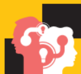
Inspiratie en leren