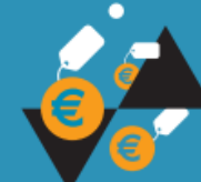
Kosten en meerwaarde