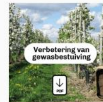
Verbetering van gewasbestuiving

Download het rapport over oecoprofielen voor het kiezen van maatregelen op landschapniveau.